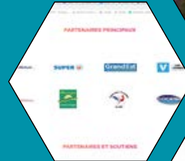
Page partenaires Site internet